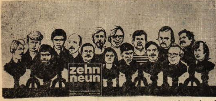
"On - Dokuz" Grubunun sergi kataloğunu süsleyen kapak

resim dalındaki orijinal eğilimlerini, teknik üstünlüklerini ve dikate değer duyarlıklarını bir kez daha belgeledi. Bir başka açıdan dedim, çünkü, bu sergi, Alman sanatçıların örgütlenme ve geniş bir çevreye yayılma çabalarını da ortaya koyuyor. Şöyle ki, "On — Dokuz'un amacı, sanat piyasasını, sanatçılar ve geniş halk kitleleri açısından ve onların yararına değiştirmektir. "Kişisel ilişkiler ve akla yatkın fiatlarla, şimdiye kadar olduğundan çok sanat alıcısı bulmak" istiyorlar. Bu amaçla, sanat eserini pahalı fiatlarla alıcılar önüne sürerek, alıcıyı ilk anda ürkütme yerine, bir ölçüde ucuz fiatlarla daha geniş bir çevrenin malı yapıyorlar. Sergilerini kendileri düzenleyip açıyor, kazanç ve zararı ortaklaşa paylaşıyorlar. Böylece sanat piyasasını yöneten aracılara da hak tanımamış oluyorlar. Bu konuda, aynı amaçla yazarların kurmuş oldukları "Yazarlar Basımevi"nden de esinlenmişler. Onlarca, "eğer sanatçı, üretim ve fiat üzerinde söz sahibi ise, bağımsızlığını ancak o zaman, bu işin ticaretini yapanların yanında koruyabilir". Adlarını da, Münih'deki 109 numaralı posta kutularından esinlenerek almışlar. Amaçlarını gerçekleştirmek için, ortak sergilerini, okullarda, üniversitelerde, çamaşır ve berber salonlarında, yurtlarda ve işyerlerinde açıyorlar.